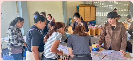
การลงทะเบียนเข้าร่วมการประชุม และรับเอกสาร

ณ หอประชุมที่ว่าการ อำเภอพะโต๊ะ จังหวัดชุมพร