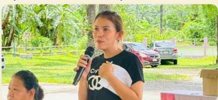
ประชาชนร่วมแสดงความคิดเห็น และให้ข้อเสนอแนะต่อโครงการ