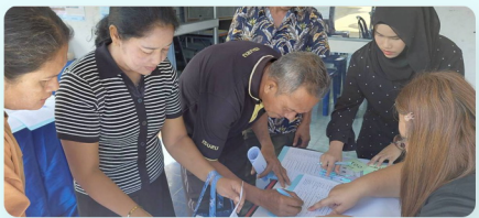
การลงทะเบียนเข้าร่วมการประชุม และรับเอกสาร

ณ ห้องประชุมองค์การ บริหารส่วนตำบลบึงหวาน อำเภอพะโต๊ะ จังหวัดชุมพร