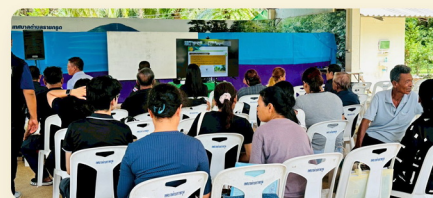
บรรยากาศการประชุม