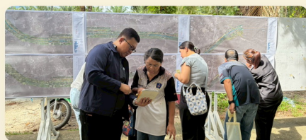
บรรยากาศการตรวจสอบกรรมสิทธิ์ที่ดิน