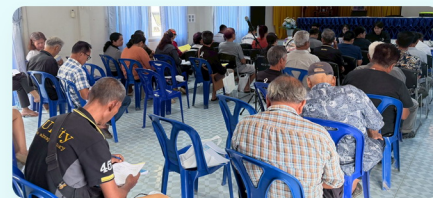
บรรยากาศการประชุม