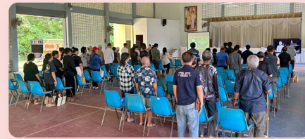
บรรยากาศการประชุม