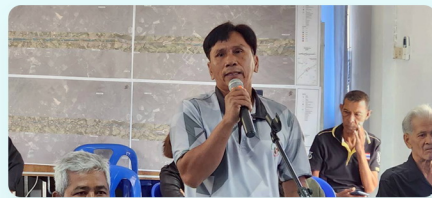
ประชาชนร่วมแสดงความคิดเห็น และให้ข้อเสนอแนะต่อโครงการ