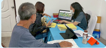
บรรยากาศการตรวจสอบกรรมสิทธิ์ที่ดิน