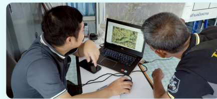
บรรยากาศการตรวจสอบกรรมสิทธิ์ที่ดิน