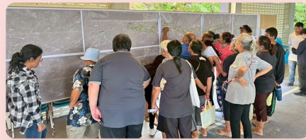
บรรยากาศการตรวจสอบกรรมสิทธิ์ที่ดิน