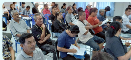
บรรยากาศการประชุม