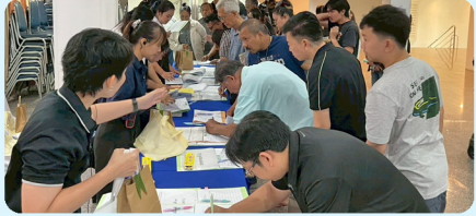
การลงทะเบียนเข้าร่วมการประชุม และรับเอกสาร

ณ ห้องประชุมแกรนด์บอลรูม โรงแรมอวยชัยแกรนด์ อำเภอหลังสวน จังหวัดชุมพร