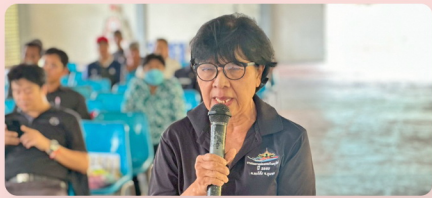
ประชาชนร่วมแสดงความคิดเห็น และให้ข้อเสนอแนะต่อโครงการ