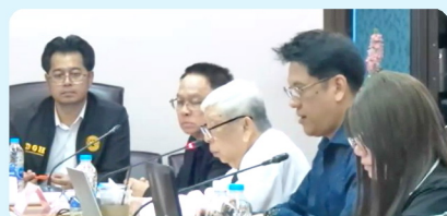
ผู้แทนกรมทางหลวง / การรถไฟแห่งประเทศไทย และกลุ่มบริษัทที่ปรึกษา ตอบข้อซักถามจาก ผู้เข้าร่วมประชุม ณ ห้องประชุมอศวิน กรมทางหลวง