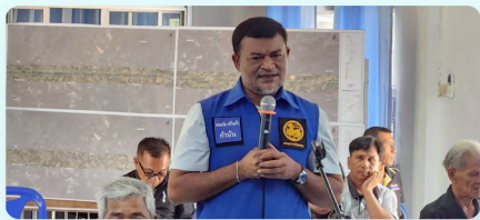
ประชาชนร่วมแสดงความคิดเห็น และให้ข้อเสนอแนะต่อโครงการ