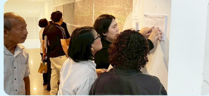
บรรยากาศการตรวจสอบกรรมสิทธิ์ที่ดิน