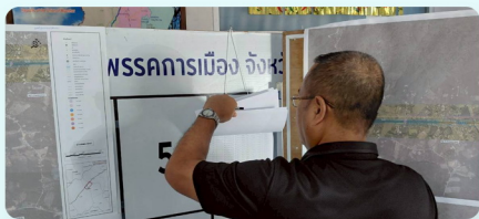
บรรยากาศการตรวจสอบกรรมสิทธิ์ที่ดิน