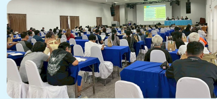
บรรยากาศการประชุม