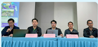
ผู้แทนกรมทางหลวง / สำนักงานนโยบายและแผนการขนส่งและจราจร และกลุ่มบริษัทที่ปรึกษา นำเสนอข้อมูลและตอบข้อซักถาม จากผู้เข้าร่วมประชุม ณ ห้องประชุมแกรนด์บอลรูมฯ