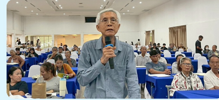
ประชาชนร่วมแสดงความคิดเห็น และให้ข้อเสนอแนะต่อโครงการ