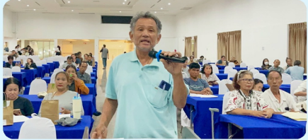
ประชาชนร่วมแสดงความคิดเห็น และให้ข้อเสนอแนะต่อโครงการ