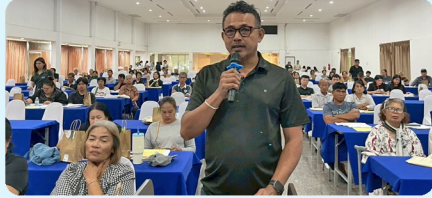
ประชาชนร่วมแสดงความคิดเห็น และให้ข้อเสนอแนะต่อโครงการ