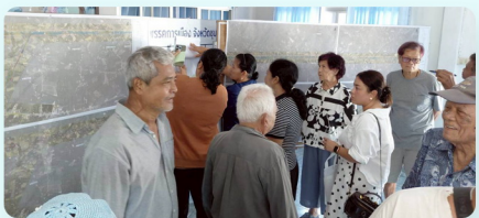
บรรยากาศการตรวจสอบกรรมสิทธิ์ที่ดิน