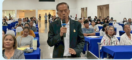
ประชาชนร่วมแสดงความคิดเห็น และให้ข้อเสนอแนะต่อโครงการ